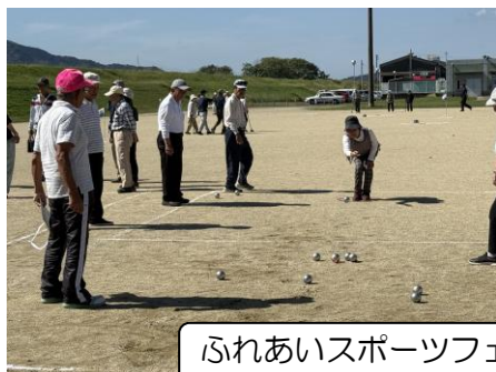
ふれあいスポーツフェスティバル伊都・橋本大会