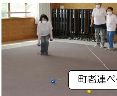
町老連ペタンク大会(予選会)

絶好のスポーツ日和で、他市町の方々と交流する機会となり、また、勝負の緊張感や喜び、楽しさを感じる一日となりました。